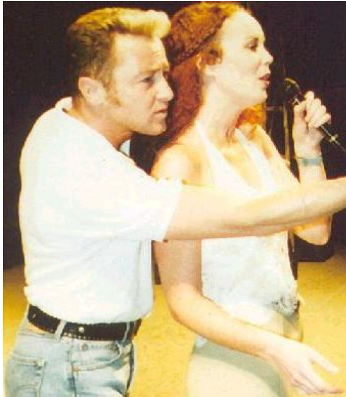
Anne und Michal Flatley beim Training und Soundcheck für Feet of Flames.