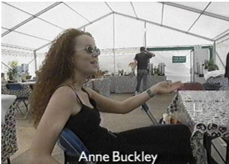
Bei einem Interview zu den Trainingsarbeiten, Hyde Park London, 1998.