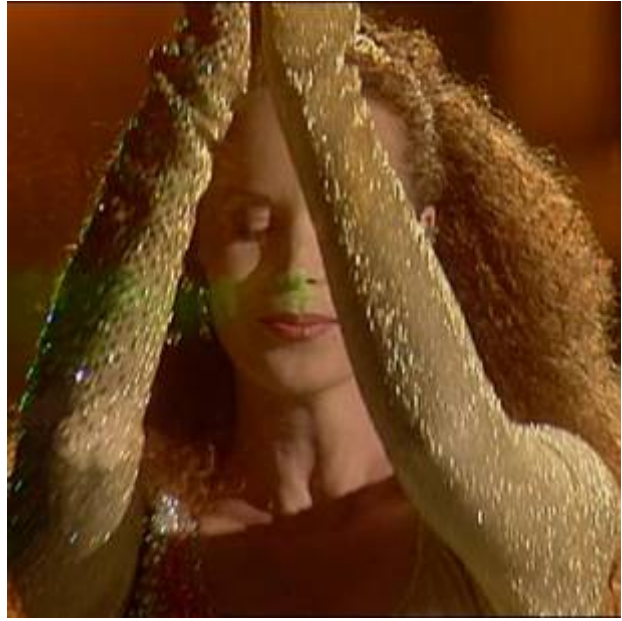
Feet of Flames 2000/2001