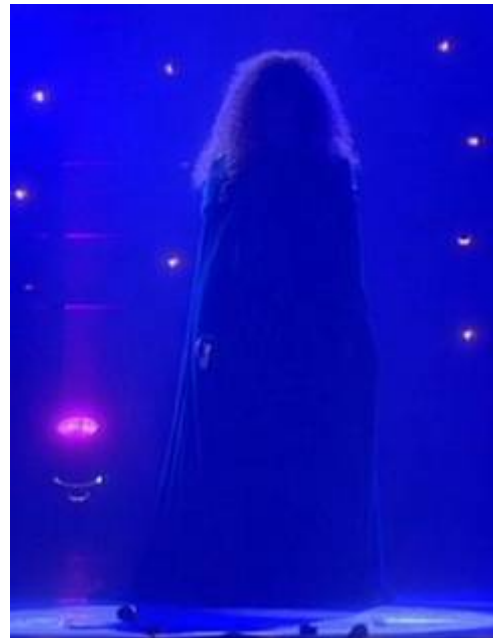
Our Wedding Day: Ihr letztes Lied in der Show.